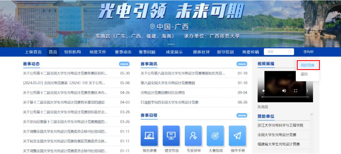
图 10： 我的竞赛