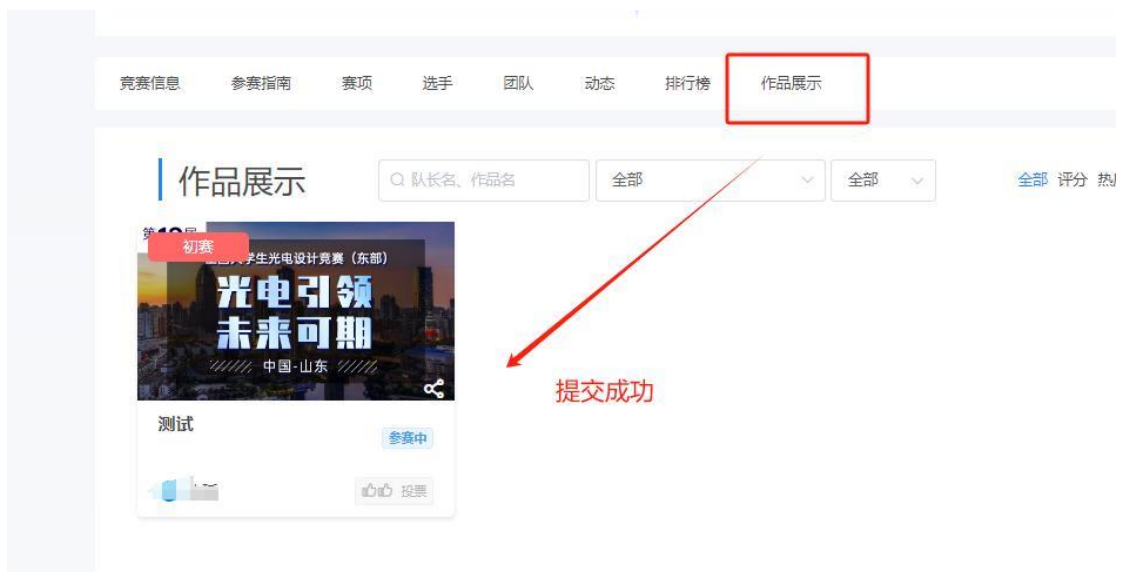
图 16：初赛作品提交成功

4.1 需要调整已上传的参赛作品，如图 17，在提交作品时间内，可反馈修改上传已提交的作品，系统以最后一次提交的为准。