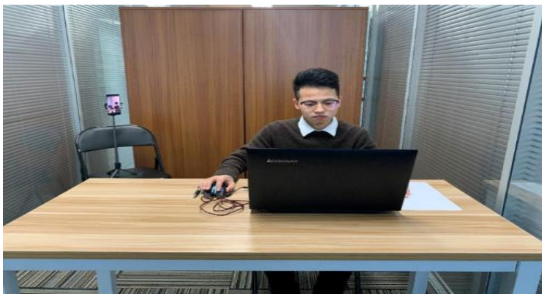
图一:电脑端正面视角

同时应在考生座位后侧面的合适位置放置移动端设备，保证移动端设备能够从后侧面拍摄到考生桌面、电脑屏幕、周围环境及考生考试全过程。正式考前，请考生务必调试好摄像角度以及距离，确保考试设备正常可用（如下图所示）。